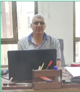
مقرر قسم علوم المحاصيل الحقلية