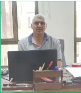
مقرر قسم علوم المحاصيل الحقلية