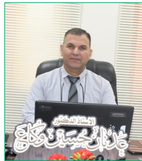
رئيس قسم علوم المحاصيل الحقلية