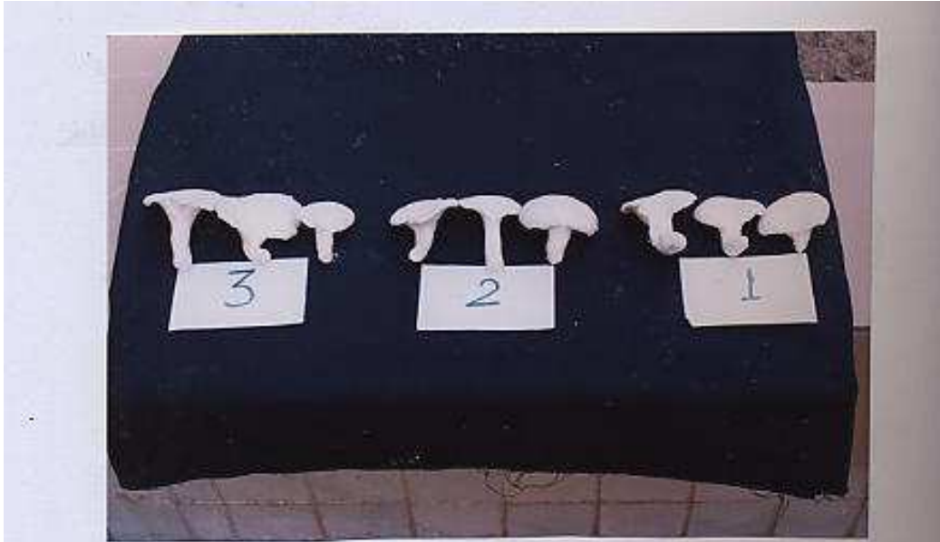
شكل (3- أ) صورة الجسم الثمري للفطر المحاري Pleurotus ostreatus