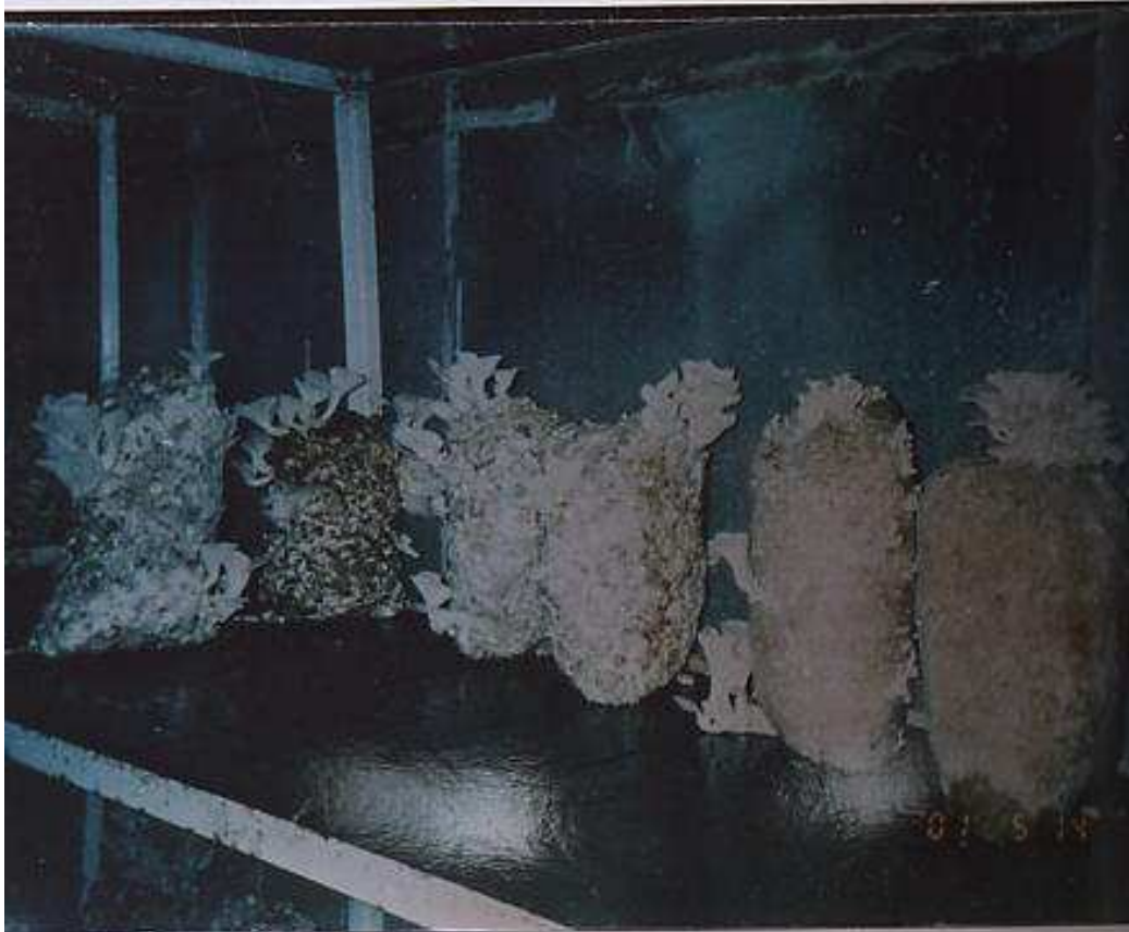
شكل (3- ب) صورة الفطر المحاري Pleurotus ostreatus المنمى على كوالج الذرة الصفراء